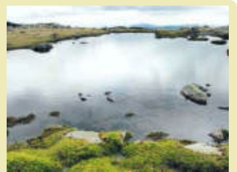
LAGUNA DE LOS CLAVELES , en el Parque Natural de Peñalara (Madrid). El autor es Iván Salgado .

Envíanos tus imágenes preferidas a periodismociudadano@20minutos.es y consulta todas las fotos en www.20minutos.es