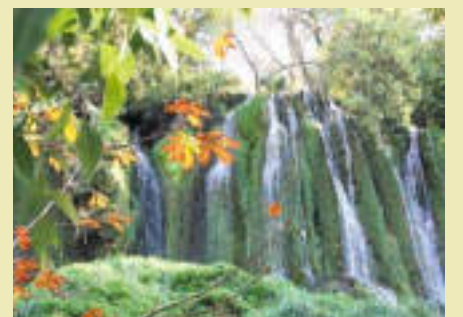
MONASTERIO DE PIEDRA . Juan Carlos Montoya retrató la imagen de esta exuberante cascada.