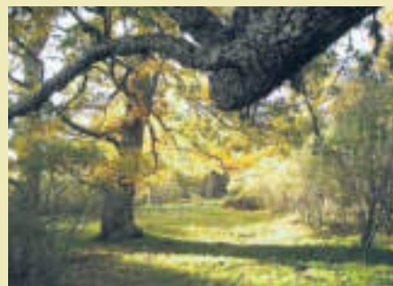
LOS ÁRBOLES SE RETUERCEN , en Barruelo de Santuyán, Valencia. Severín envía la composición.