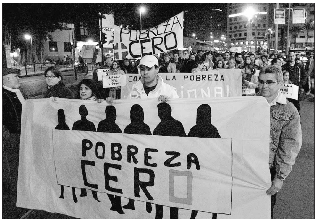
Cabecera de la manifestación en Alicante.

La Generalitat Valenciana, a través del Centro de Coordinación de Emergencias, decretó ayer la preemergencia extraordinaria ante el riesgo de que se produzcan incendios forestales en toda la Comunidad Valenciana, a causa de los vientos del noroeste que soplaron en las tres provincias.— EP