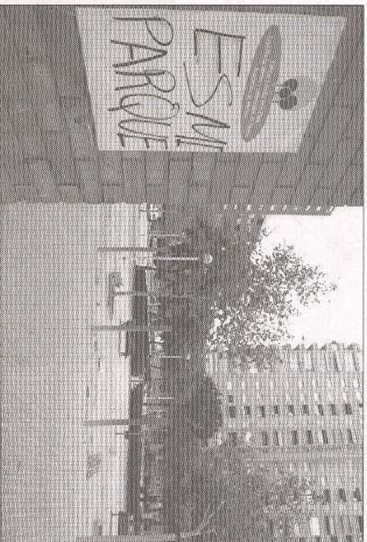
Desde hace 12 años, el Ayuntamiento ha mantenido la Plaza José María Orense como una zona verde.

Para entender el origen del conflicto hay que remontarse a 1993. Por aquel entonces, el Ayuntamiento, en un suelo de su propiedad de 5.500 metros cuadrados, construyó un parque que, en la actualidad, cuenta con "61 árboles, 13 setos bajos de jardinería, 26 bancos, 2 fuentes públicas, una zona de juegos infantiles y 22 farolas", tal y como afirma un portavoz de la Asociación de Vecinos. De hecho, numerosas inmobiliarias aprovecharon la existencia de esta zona ajardinada, colindante con la Avenida Blasco Ibáñez, como un argumento fundamental para vender los pisos que se